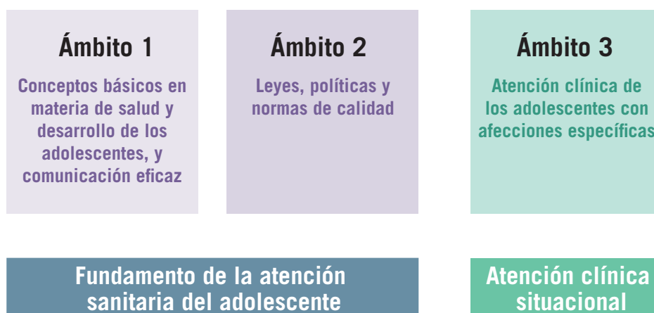
Figura 2. Tres ámbitos de la atención sanitaria de los adolescentes

Las competencias correspondientes a estos tres ámbitos se escogieron por ser específicas para los adolescentes o por guardar relación con afecciones y/o problemas de desarrollo comunes en la adolescencia. No se han tomado en cuenta aquellas competencias que, pudiendo guardar relación con la salud y el desarrollo de los adolescentes, no son específicas para estos ni están relacionadas con afecciones y problemas de desarrollo comunes en la adolescencia. Por ejemplo, las competencias relativas